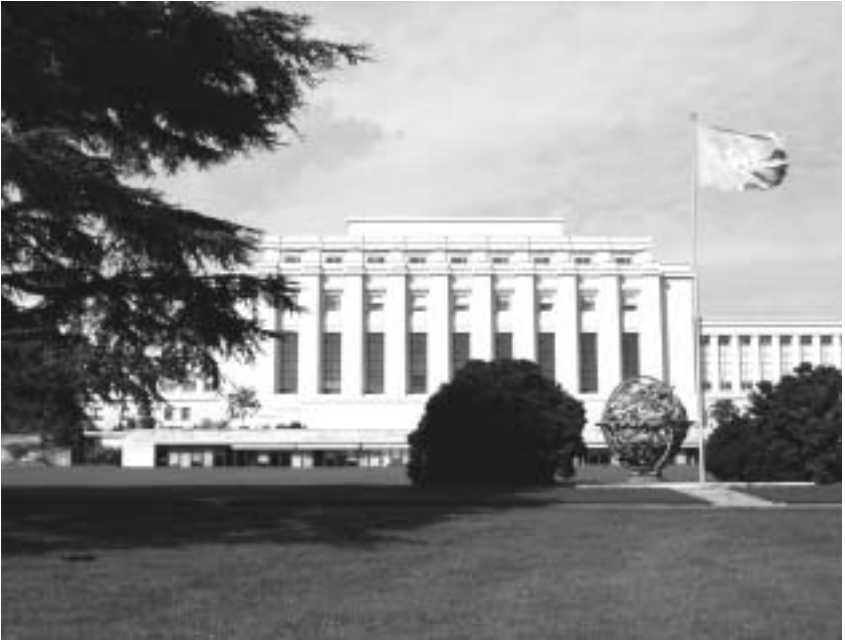
UNO-Gebäude in Genf, Schweiz